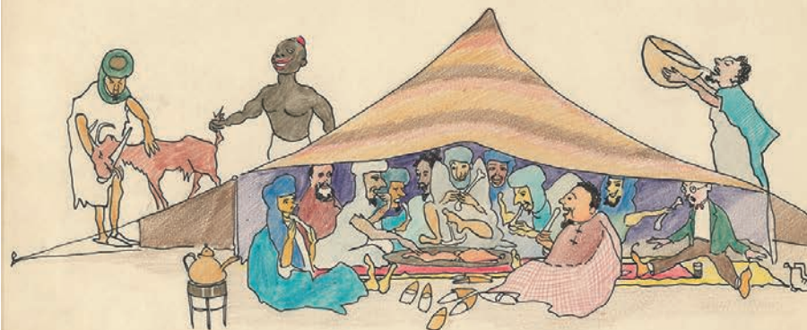
Una “jaima” sharauí (Caro Baroja a la derecha) Dibujo.

La Biblioteca “Manuel Alvar”, y con ella la Comunidad de Madrid, han querido unirse a este recuerdo.